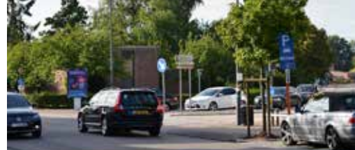
Meer aandacht voor veilig verkeer p.2