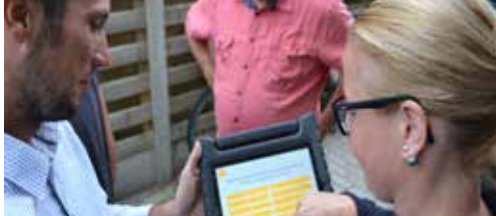
De N-VA komt naar u toe! p.2