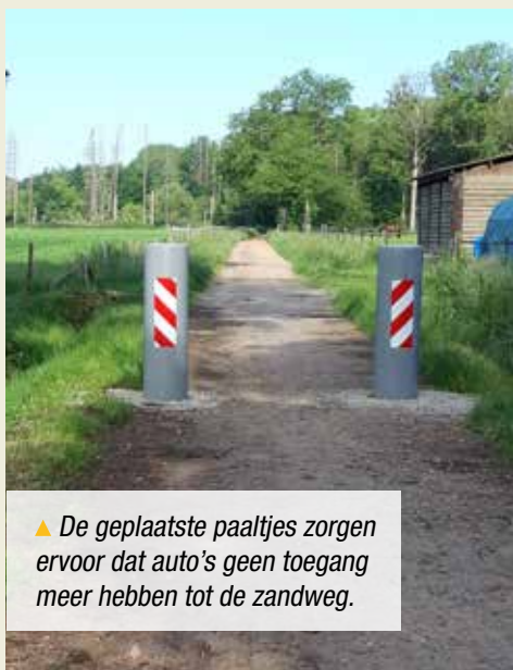
▲ De geplaatste paaltjes zorgen ervoor dat auto's geen toegang meer hebben tot de zandweg.

Het kruisen van twee voertuigen is er onmogelijk en fietsers en wandelaars werden vaak in de kant gereden door een passerend voertuig. Het leverde jarenlang de nodige discussies op. Bovendien was de Klavatterstraat een ideale route voor de jacht met de lichtbak, een vluchtweg bij alcoholcontroles op de grote baan Turnhout-Ravels (N12) en een sluiptweg voor het verkeer bij werkzaamheden op diezelfde N12. Bijgevolg was er enorm veel oneigenlijk gebruik.