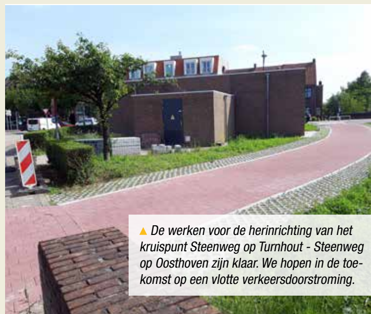
▲ De werken voor de herinrichting van het kruispunt Steenweg op Turnhout - Steenweg op Oosthoven zijn klaar. We hopen in de toekomst op een vlotte verkeersdoorstroming.

In overleg met de stad Turnhout en de aanpalende eigenaars is de weg nu vrijgemaakt van doorlopend autoverkeer. Fietsers en wandelaars die de officiële knooppuntverbindingen volgen, kunnen er voortaan met een gerust hart passeren. De Klavatterstraat of -pad heeft, na tien jaar gepalaver, nu eindelijk het statuut van een trage weg.